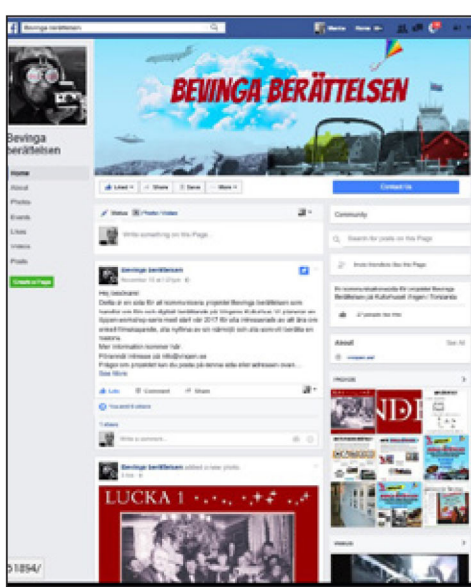
Bevinga berättelsens facebookside.