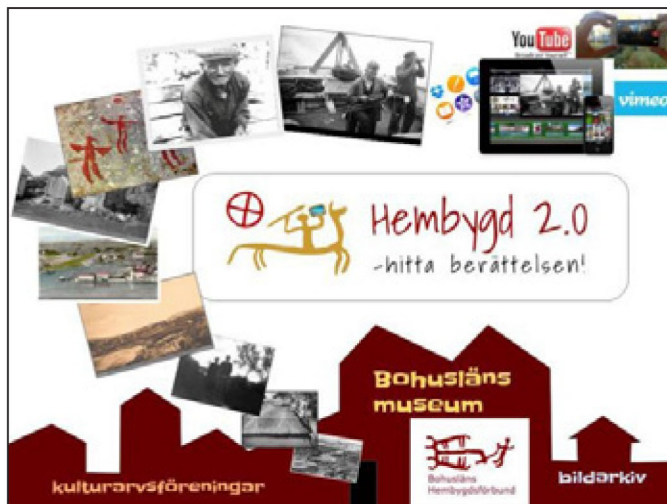
Bildcollage av Ingrid Lindberg

Berättelser bevingas och Samhället berättar 2.0